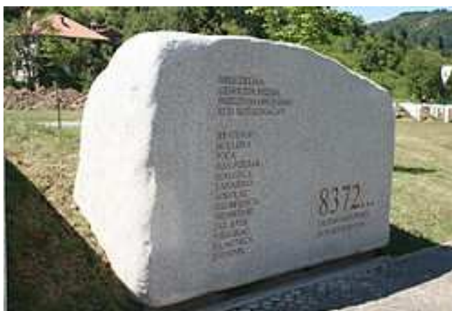
A potočari emlékmű

Jórészt ennek az uniós eseménynek a hatására, a Szerbiai Képviselőház 2010. március 31-én egy négypontos nyilatkozatot fogadott el „a srebrenicai bűncselekmény elítéléséről”, amelyben „a legélesebben elítélte a bosnyák lakosság ellen 1995-ben elkövetett bűntettet” és támogatásáról biztosította az állami szerveket az akkor még bujkáló (2011. május 31-én hágai Nemzetközi Törvényszéknek átadott) Ratko Mladić, a boszniai szerb hadsereg volt főparancsnokának letartóztatásában. Arra azonban már nem volt ereje, hogy kimondja: Srebrenicán népirtás történt. És 1944-1945-ös vajdasági vérengzésekről is tovább hallgat.