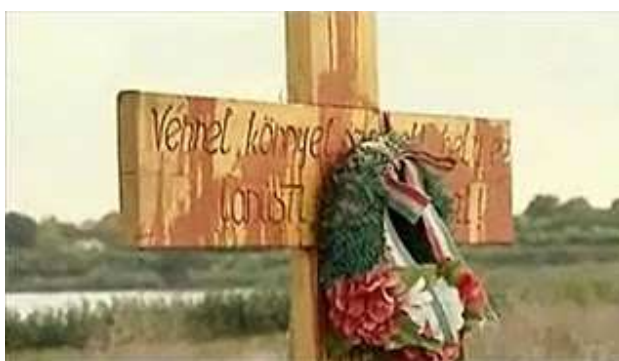
Az 1944. évi csurogi áldozatoknak emelt, vörös festékkel leöntött kereszt

A Bizottság határozatát, tartományi szervről lévén szó, a Tartományi Képviselőház is – az említett rezolúció által – semmissé nyilváníthatta volna, de ezt nem tette meg.